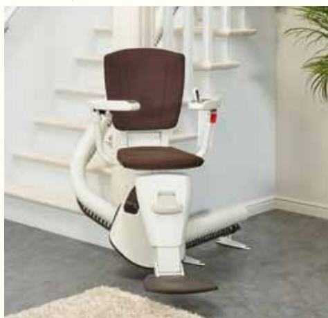
FLOW, scala curva

Ogni nostro montascale possiede caratteristiche peculiari, per adattarsi al meglio alla tua casa e alle tue esigenze. Con un binario progettato e costruito su misura ai tuoi spazi, il montascale thyssenkrupp è installabile su qualsiasi tipo di scala, curva, dritta, sia all'interno che in ambienti esterni. Ti aspetti il meglio dal tuo montascale, e con thyssenkrupp Encasa puoi averlo. Perché la tua sicurezza e quella dei tuoi cari non accettano compromessi.