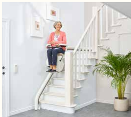
LEVANT, scala DRITTA