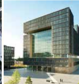
thyssenkrupp quarter Essen, Germania