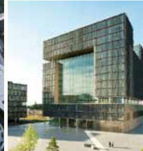
thyssenkrupp quarter Essen, Germania